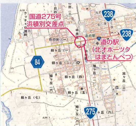
国土地理院(電子国土web)より作成