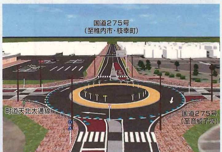
道道豊富浜頓別線 (至豊富町・クッチャロ湖)