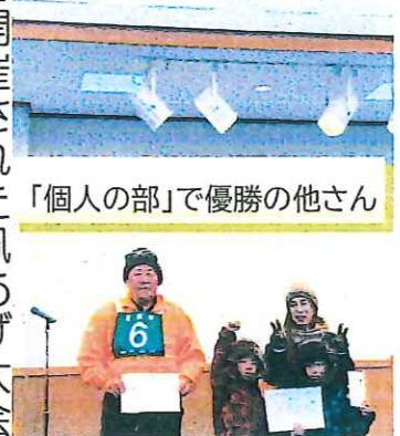
「個人の部」で優勝の他さん