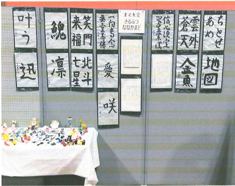
書道教室の生徒達の作品

令和7年12月18日(月) 第89号 一般社団法人 猿 払 ななかまどの会 会 報