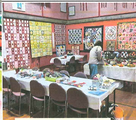
パッチワークの会

受付名簿に記載された人数は、二日間で延べ三四七名だそうで、村の人口のおよそ十三%の方が足を運んでくれた計算になります。昨年より百人ほど減りましたが、文化祭をきっかけに村の文化のさらなる発展を期待したいですね。会では、今年も文化祭の入り口でパン販売をしました。大変好評で、270個用意したパンが一日で完売。2日目に来られた方から「パン無いの？」と残念がられました。来年はもう少し多くなりました。