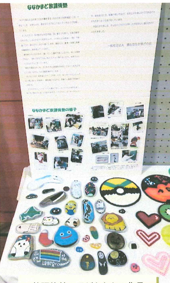
放課後塾の子どもたちの作品

十一月八日・九日、農村環境改善センターで令和七年度の「猿払村文化祭」が開催されました。文化協会加盟団体ややすらぎ苑、楽楽心、保育所、小学校の作品と一緒に、放課後塾「ななかまど」の子ども達の作品や書道教室の作品も展示させて頂きました。