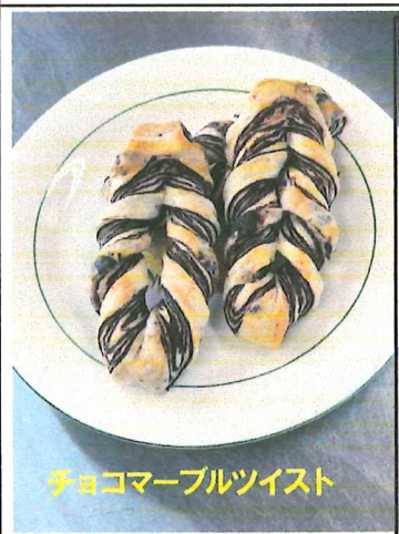
チョコマーブルツイスト

メントに練り込んだ「ホタテトラポッド」や「ホタテ」です。ホタテ貝殻は土壌改良材や牡蠣の養殖用に使われる以外廃棄されてきました。それをなんとか「地域資源」にできないかと大阪の甲子化学工業や清水建設株式会社がプロジェクトを組み完成させました。猿払村のホタテ貝殻は品質がいいので、最初に作