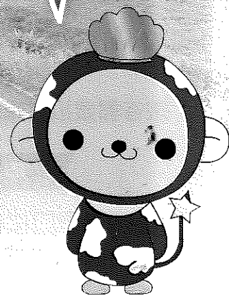
猿払村キャラクター さるっぷ