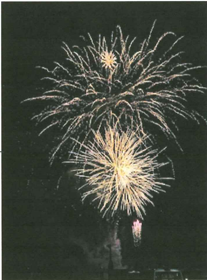
量も質も圧巻だった花火大会

七月二十日二十一日の観光まつり、五〇回の節目を迎え、天候にも恵まれて大盛況でした。