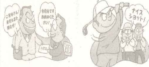
暴力団に「金を出さない」