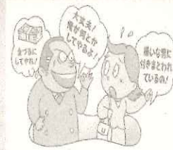
暴力団を「利用しない」

暴力団は、組織の維持・拡大のために、覚醒剤密売や特殊詐欺、密漁、みか行、覚醒剤密売や特殊詐欺等の犯罪行為を行うだけでなく、組織の関係者を利用して一般社会における経済取引へ介入する様々な手段を用いて活動資金獲得を図り、争奪を激化し、長期化させる原因となし、健全な経済活動に大きな脅威と不安を与えている。