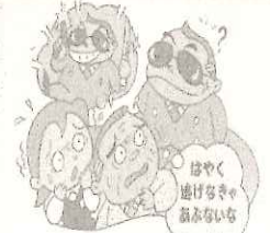
暴力団を「恐れない」