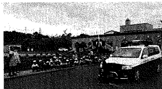
昨年度のこぐまクラブの様子