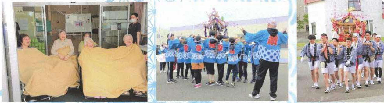
少し肌寒い気温でしたので、毛布に包まって温まりながら待ちました