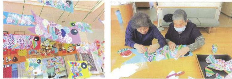
「鯉のぼり」 鱗はコーヒーフィルターと水性ペンを用い、カラフルに仕上げました。1枚1枚すべてが違う模様で、心が躍る色合いです。