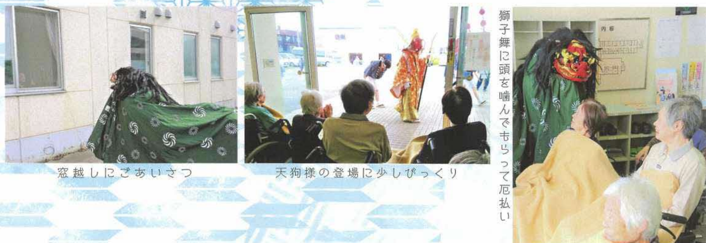
窓越しにごあいさつ