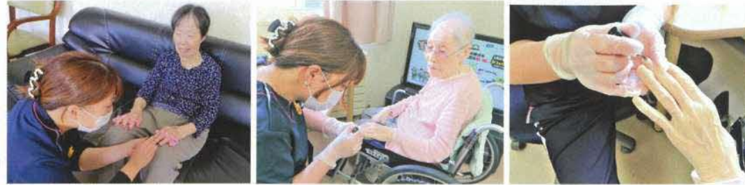
職員がネイリストになり、マニキュアを塗っていきます…