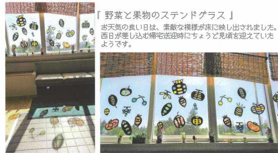
「野菜と果物のステンドグラス」 お天気の良い日は、素敵な模様様が床に映し出されました。西日が差し込む帰宅送迎時にちょうど見頃を迎えていたようです。