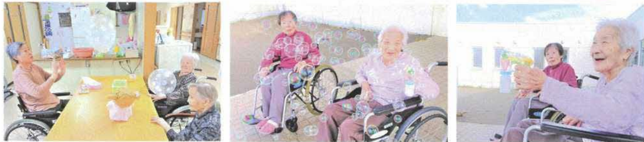
ふわふわ揺れる風船パレードに白熱！