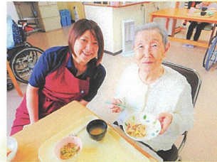
調理員さんと一緒にお昼ごはん