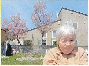
やすらぎ苑周辺をお散歩して、綺麗な桜を眺めてきました