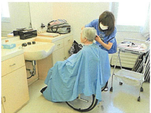
毎月、訪問理美容による散髪を依頼しています