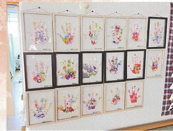
お花のシールで手形アートを作りました