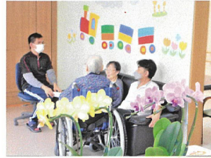
賑やかに会話も弾みます