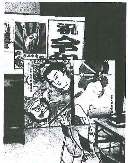
「さるふつの凧の会」