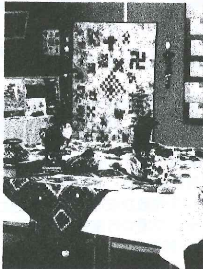
「パッチワークの会」