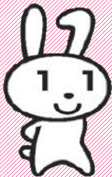
マイナポイントPRキャラクター マイナちゃん

令和3年9月末までにしたチャージまたは、お買い物がマイナポイント付与の対象となっていました。令和3年の12月末までにしたチャージまたは、お買い物まで付与の対象となるよう期間が延長されました。