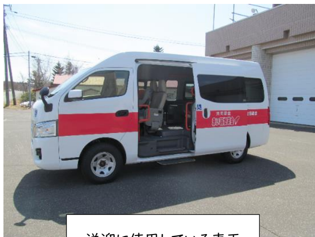
送迎に使用している車両

等とさせて頂いておりますが、利用者の希望や状況によっては、支援内容を適宜判断しながら実施することとしています。