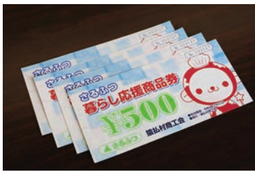
暮らし応援商品券発行事業 2,495,709円