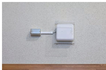
公衆無線LAN環境整備 3,168,000円