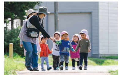
子ども医療費給付事業 3,834,874円