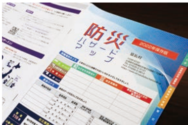
防災ハザードマップ作成 1,318,000円