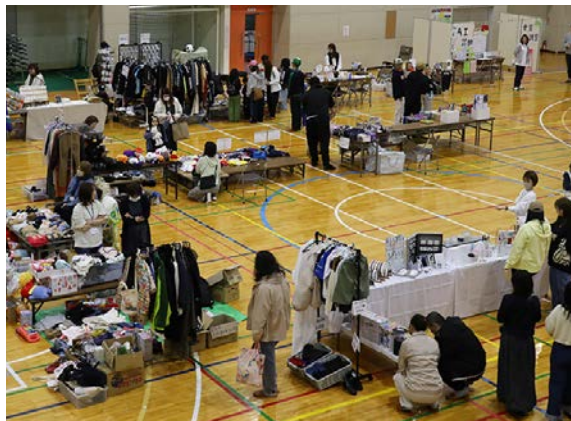
▲令和7年度 開催の様子