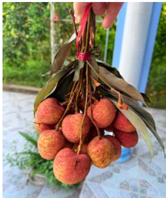
ベトナムで採れたライチ