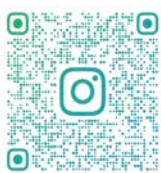
▲さるふつマーケット Instagram

今後も年に1回、sarufutsumarketを開催していきます！地域のみならず楽しんでいただける場を続けていくために、実行委員として一緒にイベントづくりに関わってくれる方や、事前準備や当日の運営を手伝ってくださるボランティアの方も募集しています。興味のある方がいれば、ぜひ気軽に声をかけていただけたら嬉しいです。