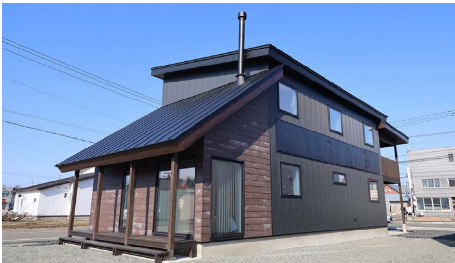
▲さるふつbaseの裏側には、特徴的な片流れ屋根と煙突