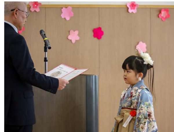
㊦ 3月24日(火) ㊦ 鬼志別保育所