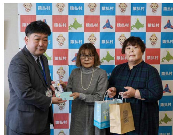
▲記念品を届けに来てくださった商工会女性部の方々