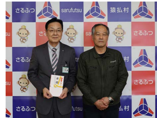
㊦ 3月19日(木) ㊦ 役場

4月からは小学生として、たくさんのごことにチャレンジし、楽しい学校生活にしてください。ご卒園おめでとうございます。