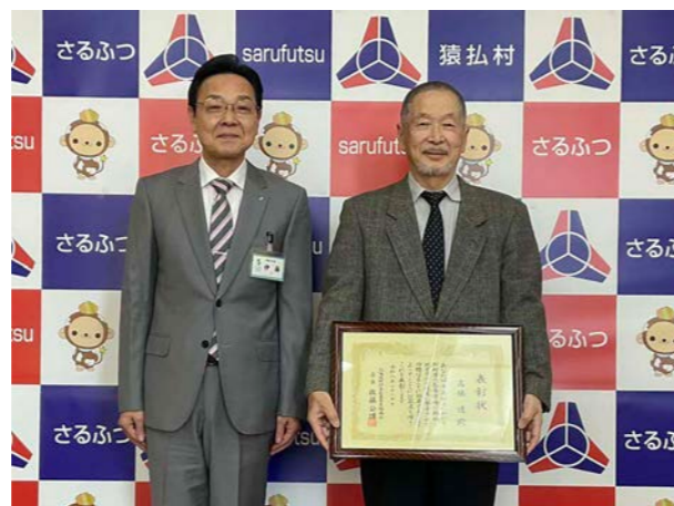
㊦ 3月30日(月) ㊦ 役場