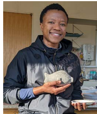
作成中のタイ焼きの形をしたオカリナ