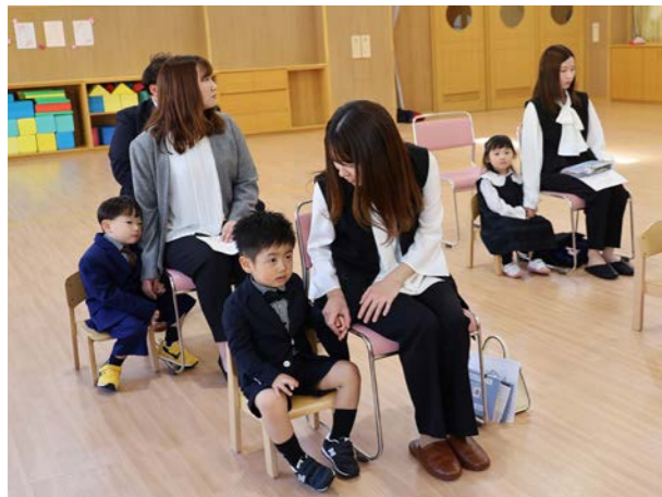
㊦ 4月3日(金) ㊦ 鬼志別保育所