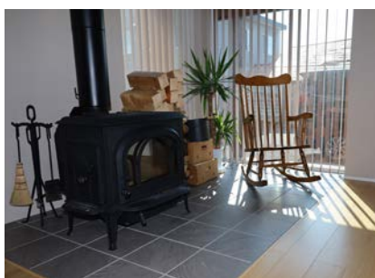
▲1Fコミュニティスペースにある薪ストーブ