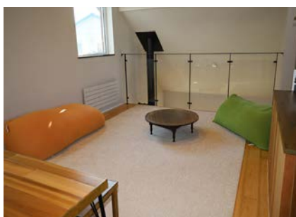
▲2Fゲスト専用のリビングスペース