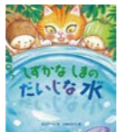
北川 チハル 著

ニャンパーは、キャンプリながらたびするねこです。「きょうは、しずかなしまでひるねしよう」はまへのみせでボートをかりて、リュックをつんで、あおいみへこぎだしますが…。さあ、どきどきわくわく、たのしいたんけんのはじまりです！