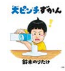
鈴木 のりたけ 著

君はガムを飲んじゃったことはある？シャンプーが目に入ったことは？大ピンチは、なんの前触れもなく君の生活に入り込んでくる。ピンチに出会うのを恐れるより、どんなピンチがあるかを知っておいた方が心の準備が出来るというもの。そんな時は、この『大ピンチずかん』。これで、いつ大ピンチが来ても大丈夫。持ち運ぶのにも便利なコンパクトサイズ。