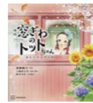
黒柳 徹子 原作

戦後もっとも売れた本『窓ぎわのトットちゃん』をストーリーブックで！読みやすい文章と約160点のアニメ絵で、映画の内容をたどることができます。すべての漢字にふりがながついていて小学校低学年からひとり読みできるのはもちろん、読み聞かせにも向き、親子で楽しめる構成です。