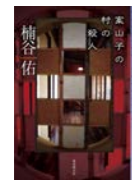
楠谷 佑 著

案山子だらけの宵待村で、案山子に毒の矢が射込まれ、別の案山子が消失し、ついに殺人事件が勃発する。現場はいわゆる“雪の密室”の様相を呈していた。俊英が二度に亘る“読者への挑戦”を掲げて謎解きの愉しみを満喫させる、正統的本格推理。合作推理作家の大学生コンビが謎に挑むシリーズ第一弾！