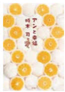
坂木 司 著

資格なし。学歴なし。得意なのは食べることと笑うこと。アンちゃんが選ぶ未来は…？「みつ屋」以外にも目が届くようになってきた今日のごころ。別れと出会いと「なんで？」を乗り越えて、アンちゃんも新しい扉を開きます。東京デパートの食品売り場から、たくさんの初めての場所へ…。甘酸っぱい謎と和菓子の世界が、あなたをお待ちしています。