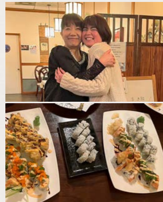
上：叔母さんとツーショット 下：アメリカで人気のお寿司