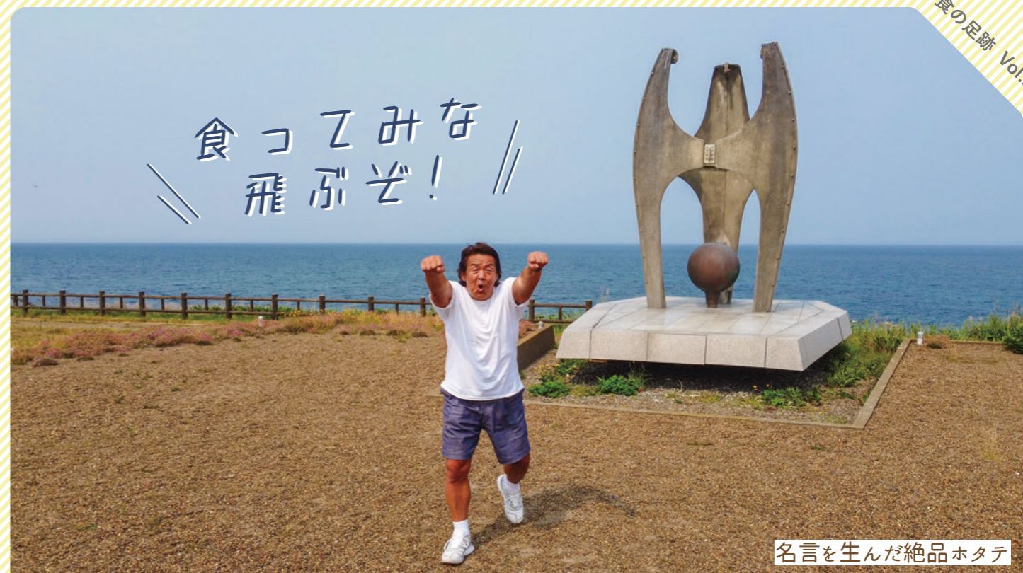
名言を生んだ絶品ホタテ