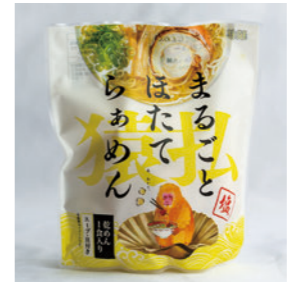
お猿のイラストが目を引く

まるごとほたてらあめん 【内容量】 1袋1食 【価格】 660円 【販売者】 株式会社野村商店 【連絡先】 2-2031