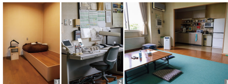
1_ 当務勤務者の休憩スペース 2_ 一角には、いつ通報が来てもすぐに対応できるよう通信設備がある 3_ 当務勤務者の仮眠スペース全4室

名に看護師1名の乗車で村外への運行となることから、この間の救急出動に備え、隊員が不足となる際は、非番者を呼び出し体制を整えています。