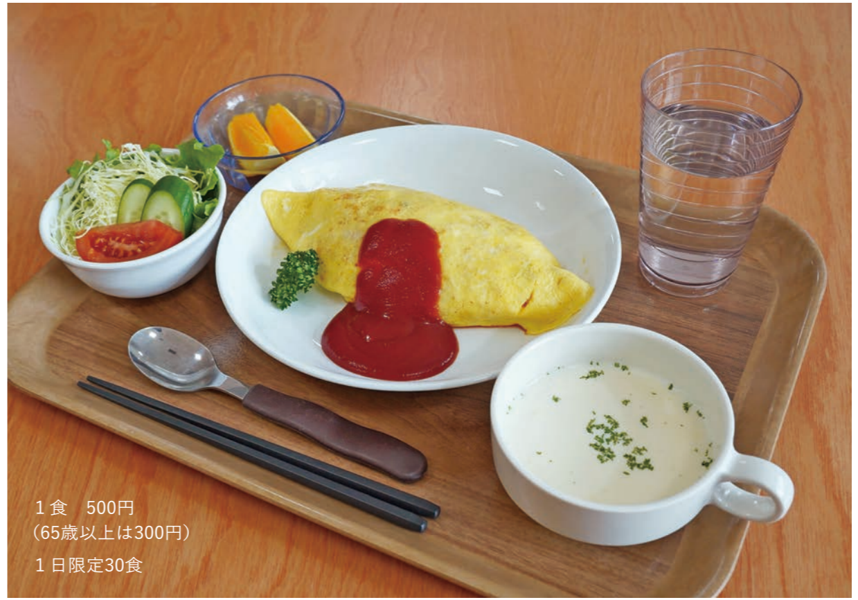
1食 500円 (65歳以上は300円) 1日限定30食

【世帯】 1,278世帯 【前月比】 -5世帯 【男性】 1,349人 【前月比】 -1人 【女性】 1,408人 【前月比】 -8人 【人口】 2,757人 【前月比】 -9人