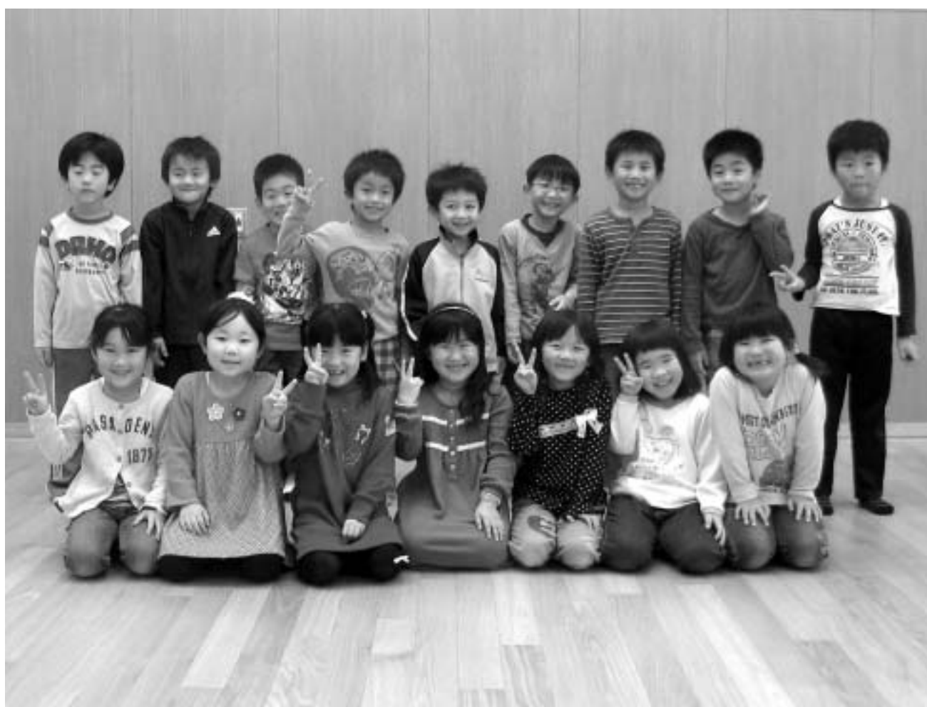
鬼志別保育所年長園児