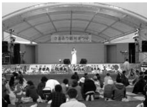
平成20年度さるふつ観光まつり前夜祭