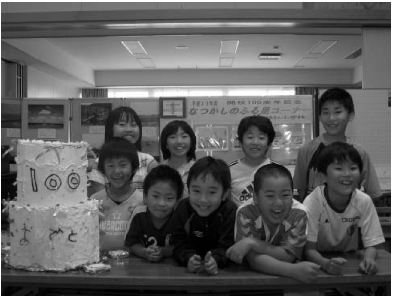
浜猿払小学校全校児童