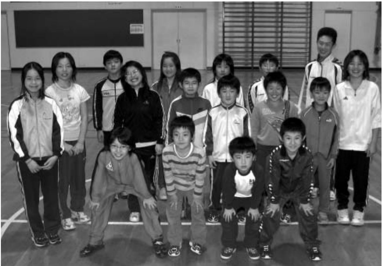
猿払村陸上少年団