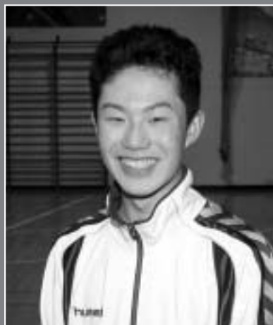
猿払村陸上少年団