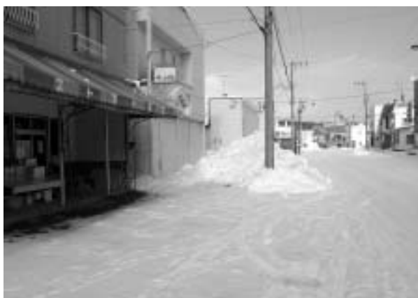
■むらに一言でご意見のあった道道の歩道の状況 [撮影：平成19年12月12日]