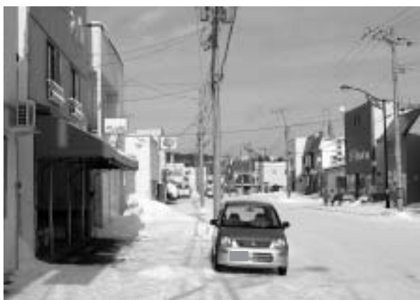
■現在の道道の状況 [撮影：平成19年12月27日]

冬の雪道を確保するためにも、住民の皆さまの協力のもと、除雪が行われていますので、よろしくお願い致します。