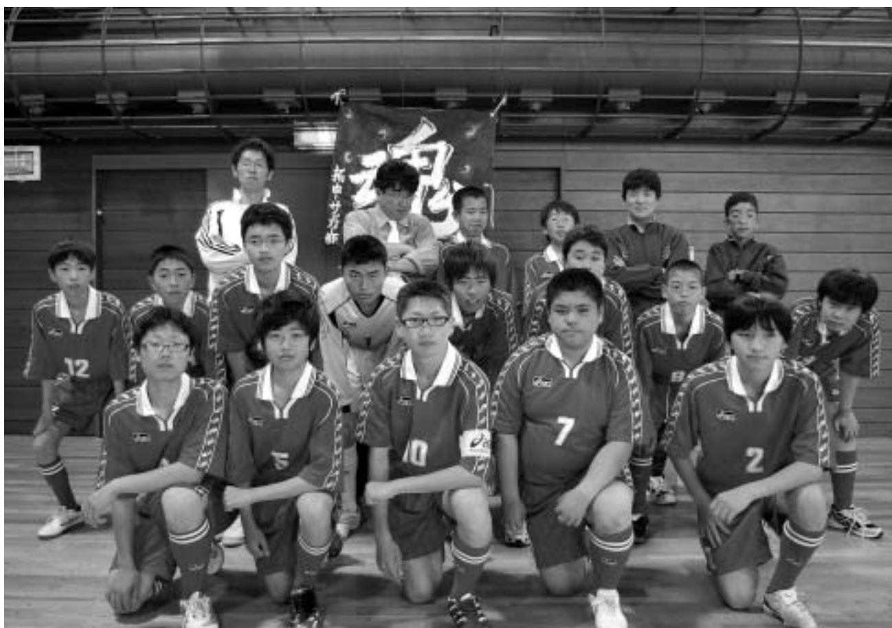
拓心中学校サッカー部