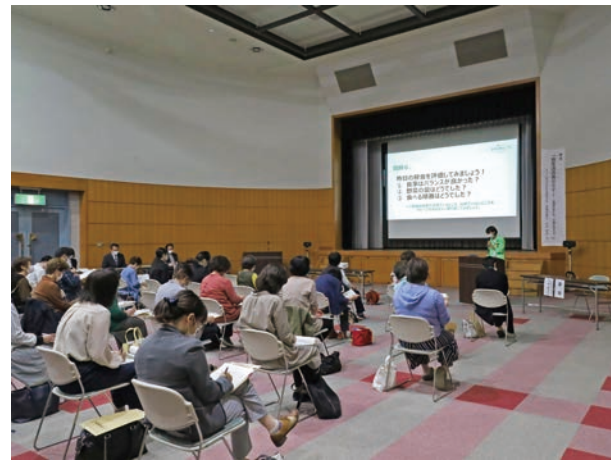
☐ 10月9日(土) 場 役場

猿払村漁業協同組合のご厚意による「村民ホタテ配布」が行われ、漁業関係者の世帯を除く780世帯に、その日水揚げされたばかりの新鮮なホタテ貝が1世帯につき20枚配布されました。 この取組みは、「資源枯渇の時代から現在の豊かな海を取り戻すことができたのは村の支援があること」と昭和51年から毎年行われている伝統的な取組みです。 村民からは「毎年おいしいホタテをありがとう」など感謝の声が寄せられました。