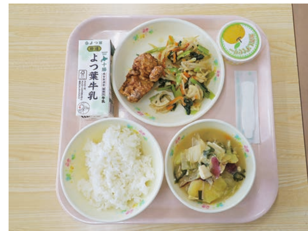
☎ 10月14日(木) 場 村内小中学校 コラボ給食で互いの魅力を知る