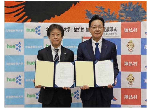
☎ 10月12日(火) 場 役場 学習支援の推進を目指して

ほかに、歌に合わせて体の部位を覚える「ポンポン体操」では、お母さんの膝の上で楽しそうに歌を歌う子どもたちの様子がとても印象的で、笑顔の絶えない楽しい時間を過ごしました。