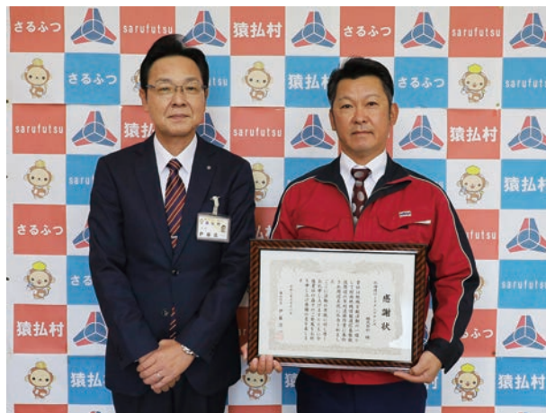
☎ 10月18日(月) 場 役場 村内の環境美化活動に感謝を込めて

今後は、オンラインでの交流や学習、同大学の学生による教育実習など、学習支援の向上に向けた活動を行っていきます。