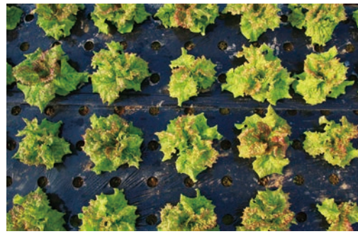
※マルチとは…野菜の生育に必要な土の温度調整などを行うため、黒いビニールを畝に覆いかぶせるもの。

猿払村の「イチゴ・葉物野菜」の栽培もいよいよ2期目に突入しました。9月下旬に、2棟ある園芸ハウスのうち1棟は、イチゴ栽培に使用していた高設ベンチやプランターなどを全て撤去しました。土に肥料や石灰などを混ぜながら耕運機で土を耕し、畝を立てた後にマルチ※をかけ、苗の定植が完了。いよいよ「葉物野菜」の栽培を開始しました。