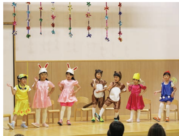
☎ 10月17日(日) 場 鬼志別保育所 上手にできたよ！

この感謝状は、地域貢献活動の一環として、村内の音声告知放送システム機器収容設備周辺の草刈り作業に奉仕され、本村の地域情報通信基盤施設周辺の環境美化に寄与されたことに感謝の意を込め贈られました。