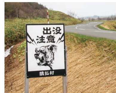
▲村ではヒグマの目撃情報があった周辺に注意喚起の看板を設置している

いっているのか、減っているか増えていくかなどを知ることができます。過去の調査結果を見ると、たった1時間程度で、70頭以上ものシカを確認したこともありま