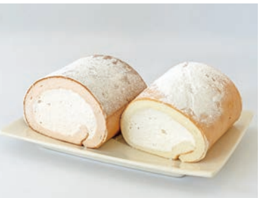
クリームがたっぷり詰まっている