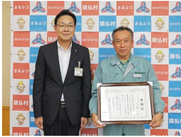
☐ 10月6日(水) 場 役場