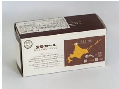
猿払村が一目でわかるよう工夫