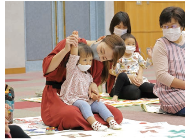
☎ 10月13日(水) 場 役場 リズムに乗って1・2・3♪

この感謝状は、地域貢献活動の一環として、さるふつ公園内駐車場の区画線整備を実施し、本村の環境美化活動に寄与されたことに感謝の意を込めて贈られました。