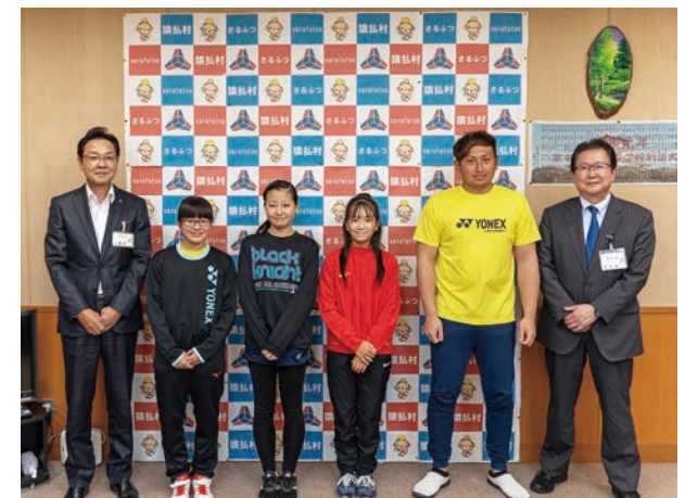
☎ 10月13日(水) 場 役場 全カプレーで目指せ優勝！

感染症対策として一人一人の席を離し、黙食での給食となりましたが、児童はとておいしそうにコラボ給食を味わっていました。