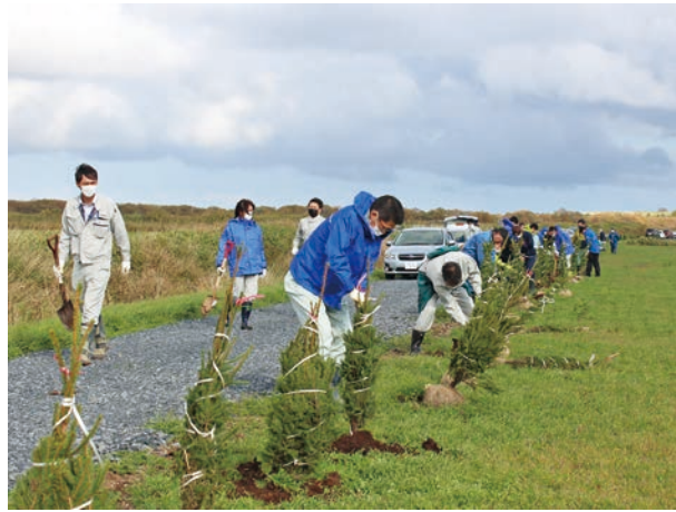
☎ 10月15日(金) 場 村内 河川の環境を整備

芦野豊里1号排水路沿いで「国営総合農地防災事業（ポロ沼地区）」の取組みとして、中山間地域等直接支払交付金を活用し植樹活動が行われました。この事業は、本年度最終年となり、河川への土壌流出の防止や環境整備を目的に毎年行われてきました。