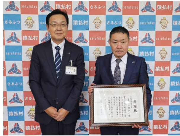
☎ 10月14日(木) 場 役場 (株)北進建設へ感謝状贈呈

本年は地域農業者や東宗谷農協職員、村役場職員、稚内開発建設部職員、宗谷地域農業振興協力会「天北会」を始めとする関係団体より約50名が集まり、400本のアカエゾマツを植樹しました。