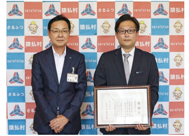
☐ 9月10日(金) 場 役場

今年度も感染症の影響で、敬老会の開催が中止になったことから、対象の方へ敬老のお祝い品を贈呈しました。 敬老のお祝い品は、ホタテのりやホタテご飯の素など地元の商品とし、やすらぎ苑などの施設入所者や村外在住の方にはタオルの詰め合わせを贈りました。 お祝い品を受け取った方は、「ありがとう」と笑顔でした。