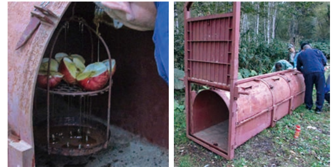
▲はこ罠設置の様子。中には動物をおびき寄せるための果物を入れる。

猟友会の活動は仕事の合間を縫って行い、一人での行動がほとんどですが、休日などはグループ猟もしています。